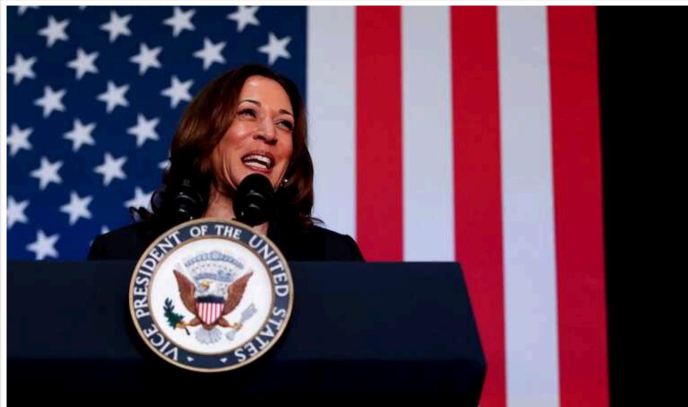
Гарріс заручилася підтримкою достатньої кількості демократів, щоб стати кандидатом у президенти від своєї партії

Такими є результати опитування, яке провело агентство Associated Press серед делегатів запланованого на серпень партійного з'їзду.