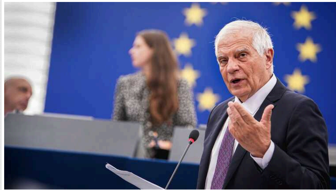
Участь РФ у наступному Саміті миру має відбуватися «на основі міжнародного права», а не пропозицій Путіна