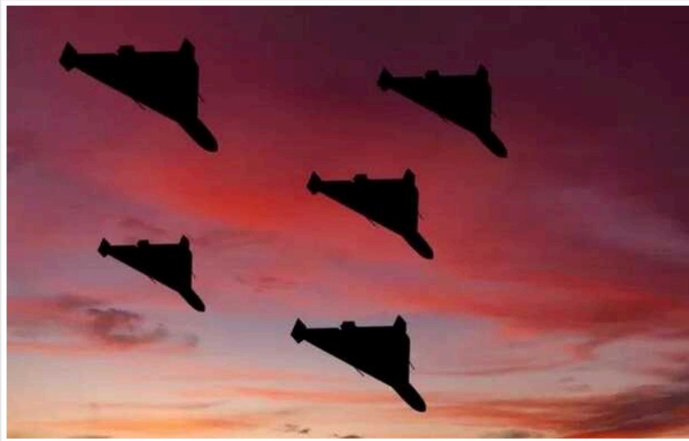
Окупанти запустили по Україні ракету й 8 «шахедів»: 7 дронів знищено

Захисники неба України в ніч на 23 липня відбивали повітряний напад Росії, який та здійснила авіаракетою і вісьмома дронами-камікадзе типу Shahed-131/136. Вдалося знешкодити сім ударних безпілотників.