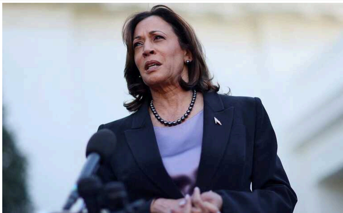
У США за добу на кампанію Гарріс зібрали рекордну суму у 81 мільйон доларів

У команді Гарріс кажуть про історичний рекорд зборів на її кампанію в межах однієї доби – сума сягнула 81 мільйона доларів.