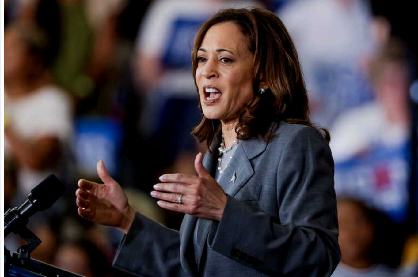
Камала Гарріс набрала достатньо голосів, щоб стати кандидатом у президенти США, – ЗМІ

Віцепрезидент США Камала Гарріс набрала достатньо голосів делегатів, щоб стати кандидатом у президенти США від Демократичної партії.