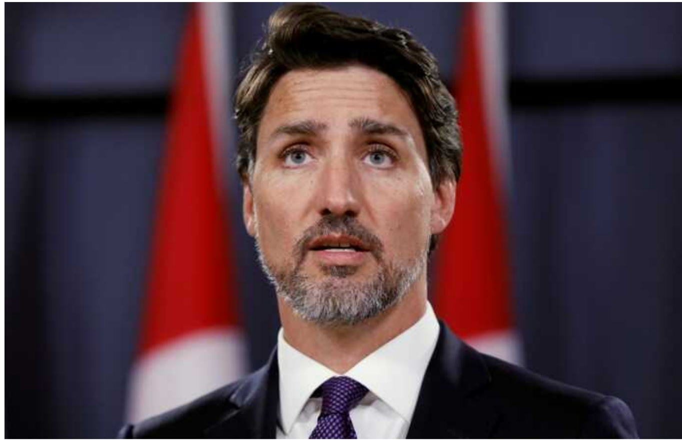
У Канаді висунули звинувачення двом чоловікам через погрози вбивства Трюдо

У понеділок канадська поліція висунула звинувачення двом чоловікам з Альберти у погрозах на адресу прем'єр-міністра Джастіна Трюдо та інших політичних лідерів Канади.