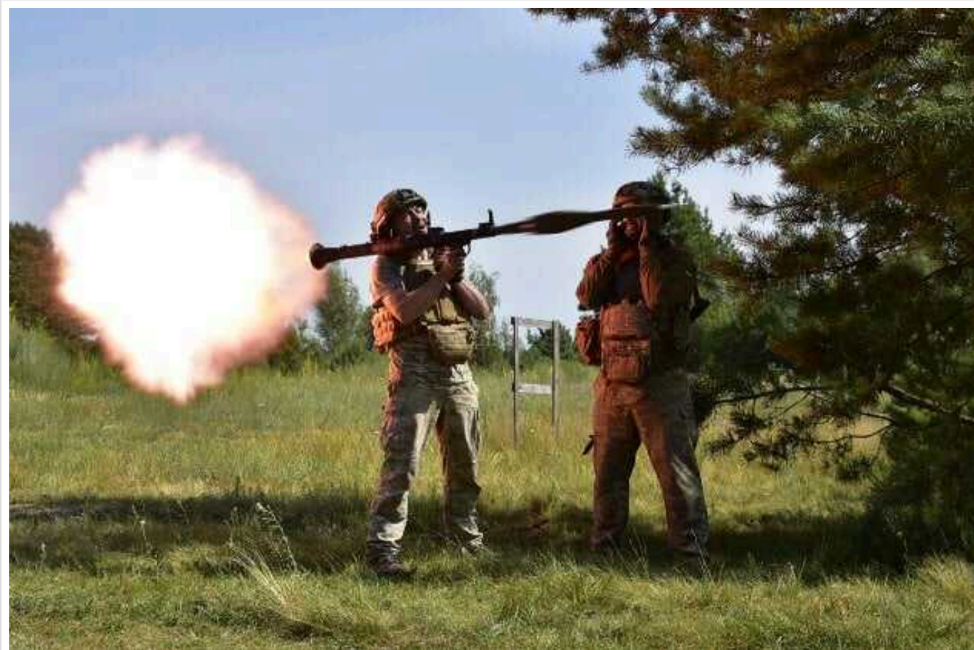
Втрати ворога: ЗСУ «відмінували» ще 1220 окупантів та 57 артсистем ворога

Сили оборони України під час боїв на фронті минулої доби знешкодили 1220 військовослужбовців окупаційної армії РФ. Тож загальна кількість втрат живої сили агресора зросла до 568 980.