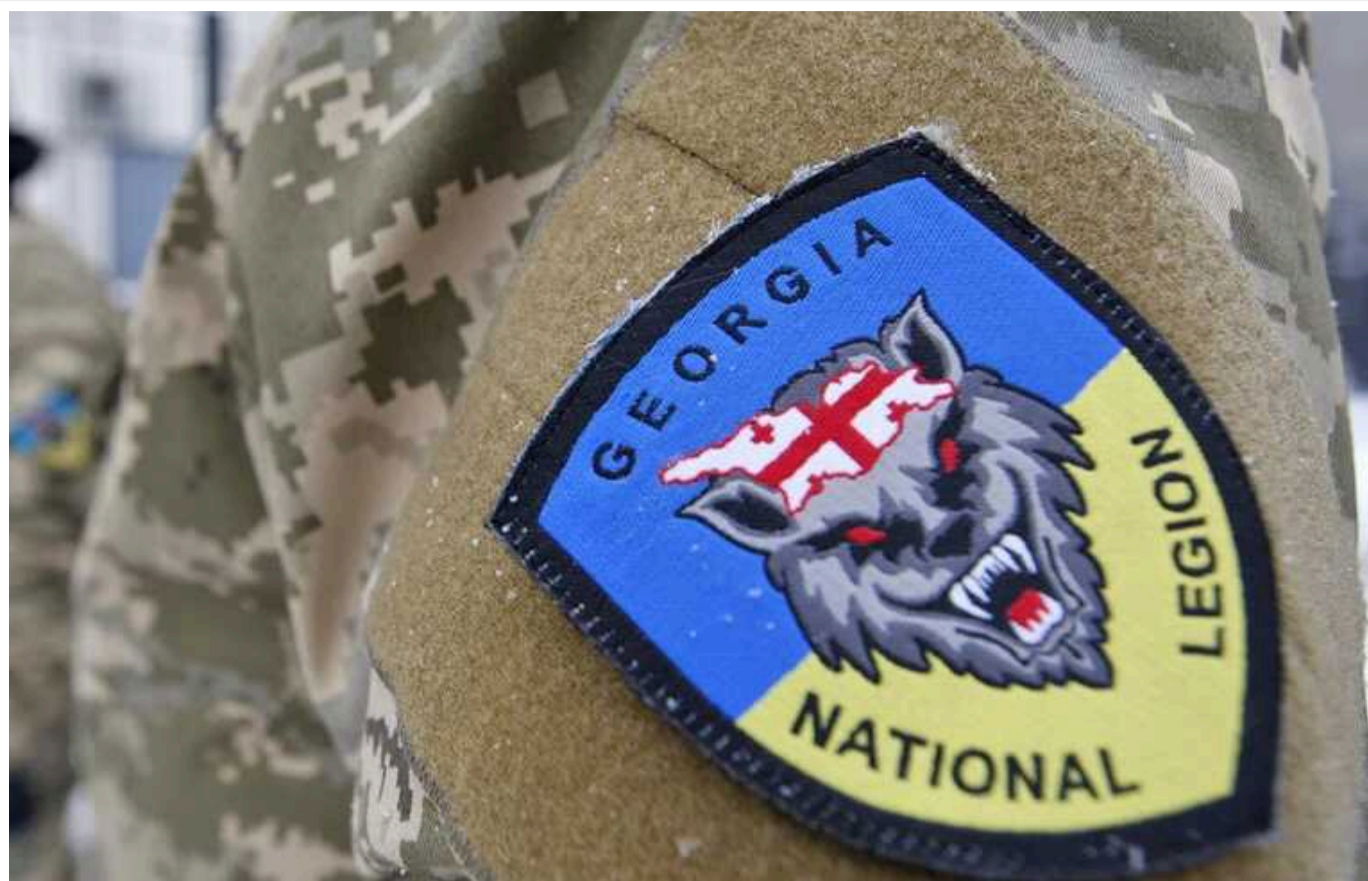
У Грузії оголосили у розшук сотні добровольців, які воювали на боці України, – ISW

Грузинська влада оголосила в розшук вже близько 300 своїх громадян, які служили добровольцями у Грузинському національному легіоні разом із українськими Силами оборони. Більшість із них нині перебувають в Україні.