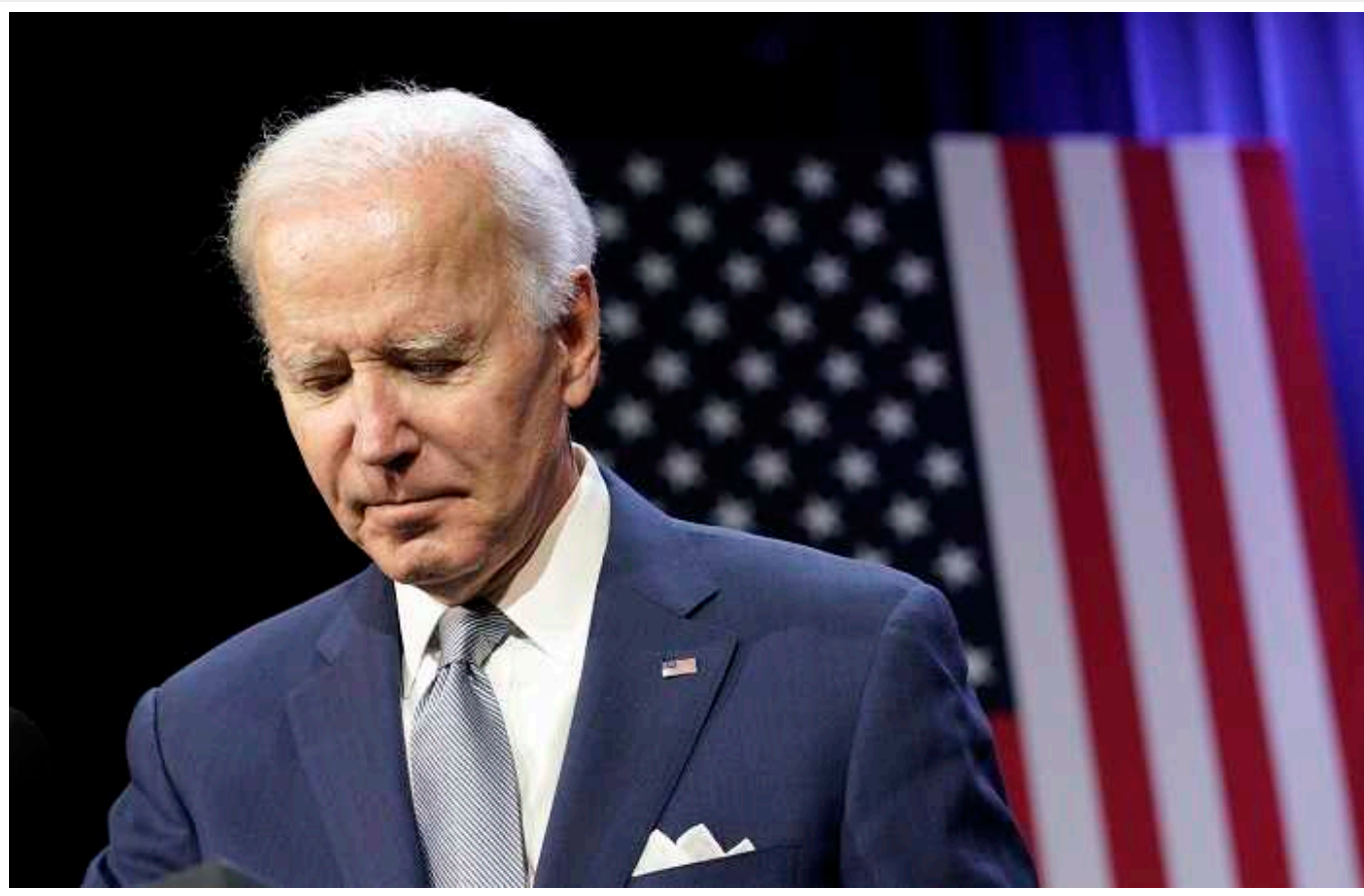
Байден заявив, що не покине пост президента

«Ми – Сполучені Штати Америки, і немає нічого неможливого, якщо ми зробимо це разом. Нам потрібно пам'ятати, хто ми. Я присвятив своє президентство доказу цього і продовжуватиму робити це сьогодні, завтра і кожного дня, коли маю честь бути вашим президентом», – написав він у X.