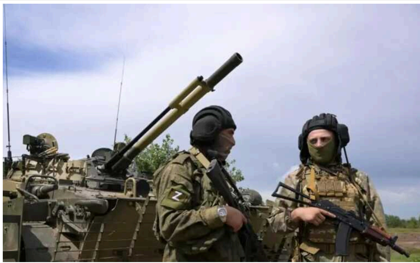
Армія РФ може посилити бойові дії, - майор запасу ЗСУ