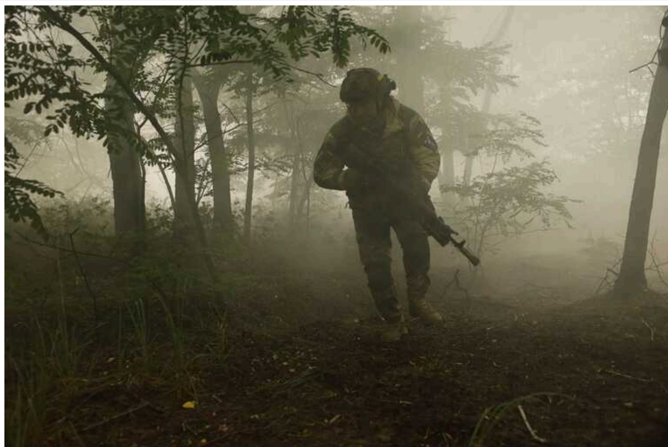
Ситуація на фронті: протягом доби відбулося 133 бойових зіткнень

Станом на 22:00, 22 липня, на фронті протягом доби відбулося 133 бойових зіткнень. Ворог активізувався на Краматорському напрямку, здійснив спроби прорвати оборону на Покровському.