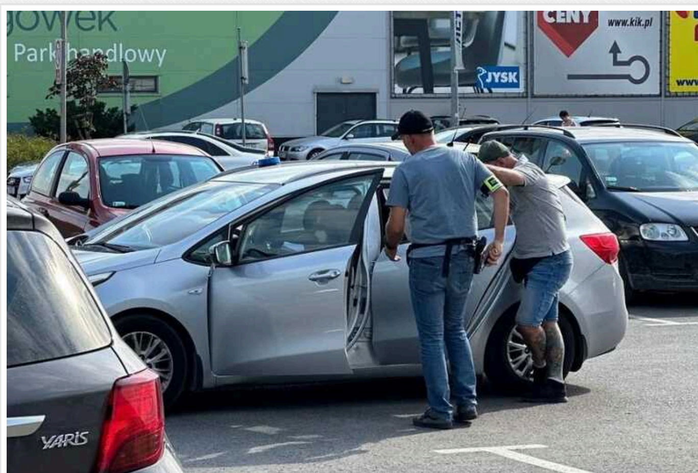
У Польщі чоловік поранив ножем двох українських підлітків

Сьогодні вдень у польському Бродновському лісі озброєний ножем 26-річний чоловік поранив двох 15-річних хлопців з України, які були доставлені до лікарні.