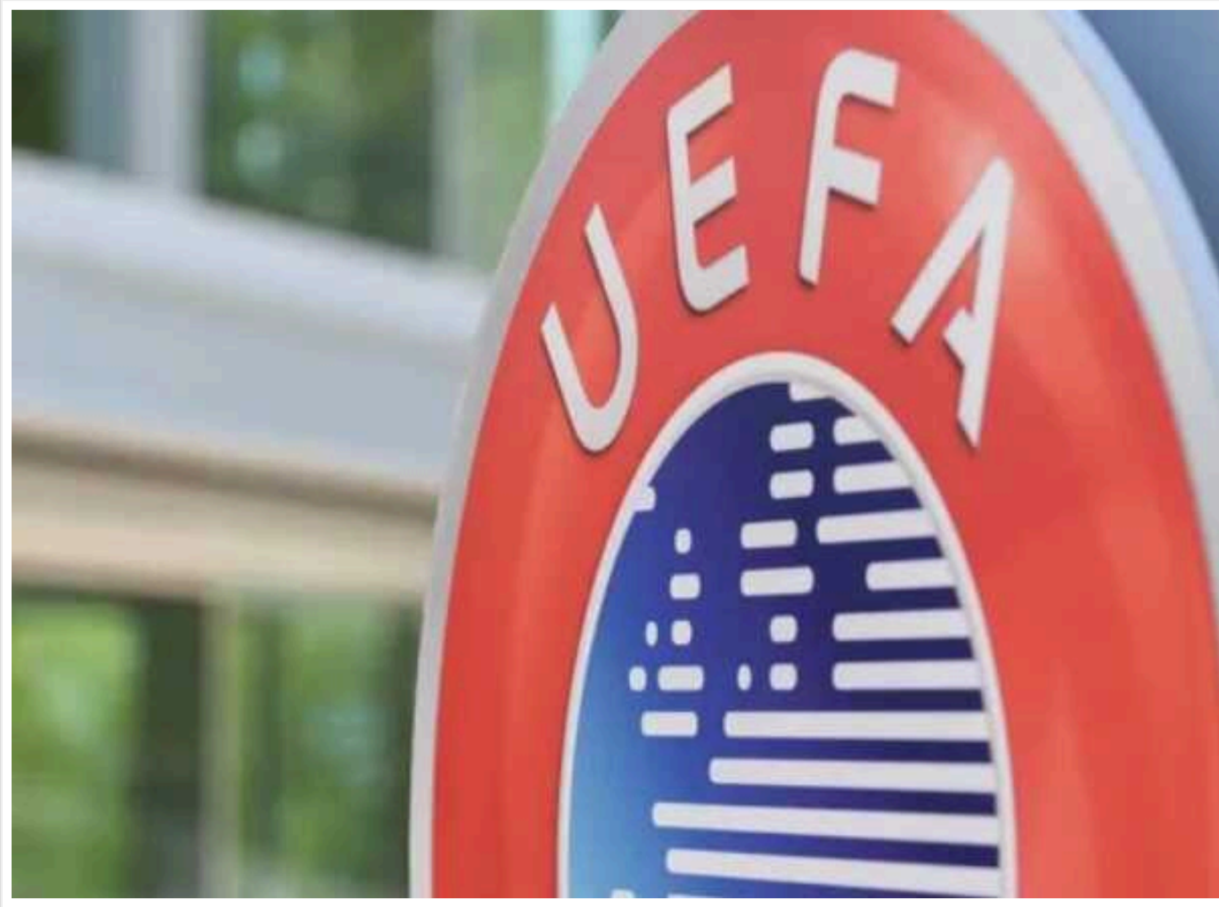
УЄФА зарахував українцям технічну поразку у матчах Ліги конференцій

Європейський футбольний союз (УЄФА) зарахував дві технічні поразки з рахунком 0:3 СК "Дніпро-1" у матчах другого кваліфікаційного раунду Ліги конференцій з угорською "Академією Пушкаш". Таким чином, організація відреагувала на те, що українська команда знялася з нового розіграшу чемпіонату країни (УПЛ).