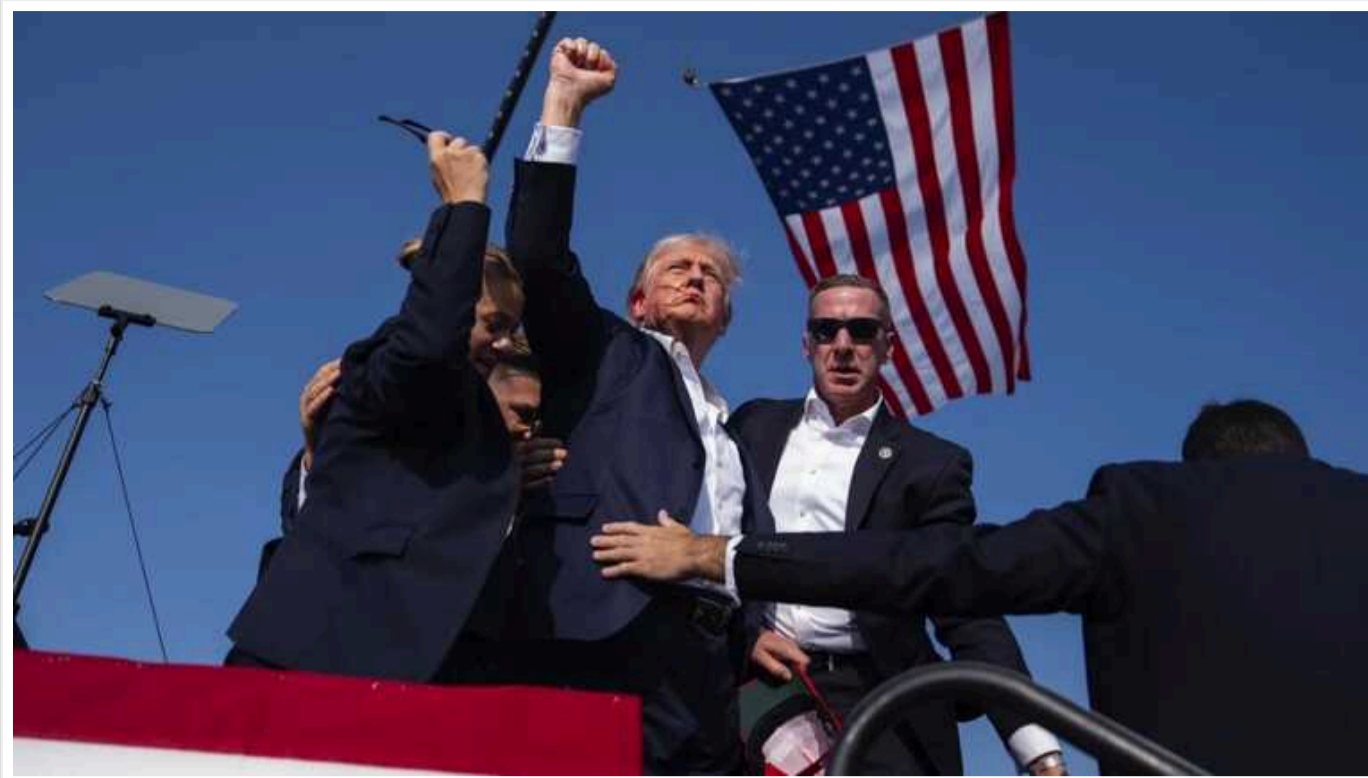
У США в Секретній службі визнали, що не забезпечили Трампа необхідним рівнем захисту

Директорка Секретної служби США Кімберлі Читл заявила, що її агентство не змогло виконати одне зі своїх головних завдань – належно забезпечити захист 45-го президента Дональда Трампа, якого поранили на мітингу. Вона пообіцяла зробити все, щоб подібне ніколи не повторилося.