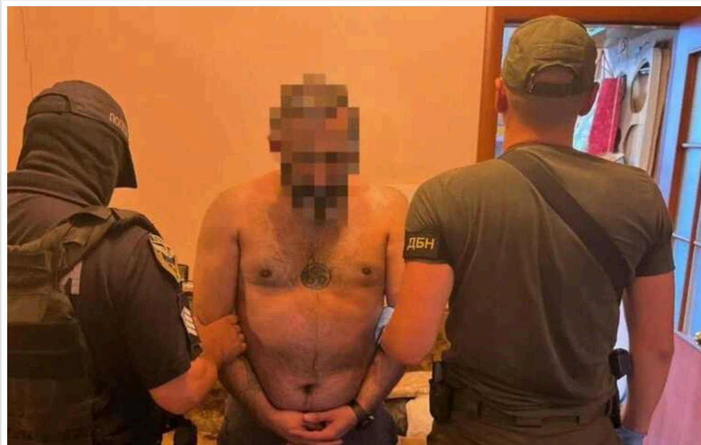
В Україні перекрили широкий канал збуту психотропів і наркотиків

Нацполіція ліквідувала масштабний наркокартель, який збував наркотики та психотропи через інтернет на понад 11,5 млн грн щомісяця. Поліцейські провели спеоперацію на території дев'яти регіонів України та затримали 14 наркодилерів, які розповсюджували наркотичні речовини, використовуючи розгалужену мережу Telegram-каналів.