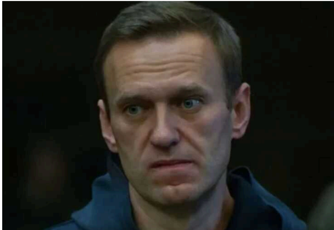
У РФ Верховний суд залишив без змін останній вирок Навальному

Верховний суд Російської Федерації залишив без змін останній вирок опозиціонеру Олексію Навальному. Він буде "сидіти в тюрмі" навіть через майже пів року після своєї смерті.