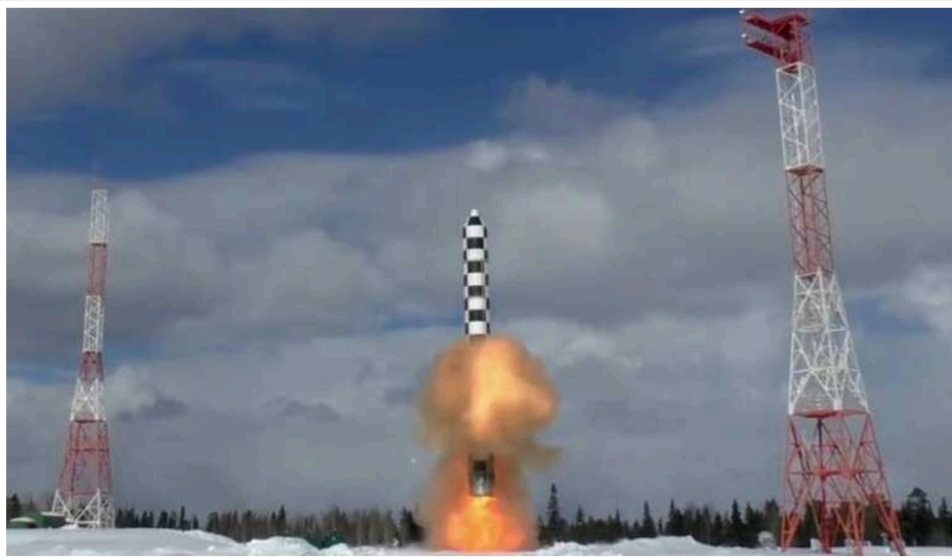
Пентагон: Ослаблення сил привело Росію до ідеї "асиметричної" космічної ядерної зброї