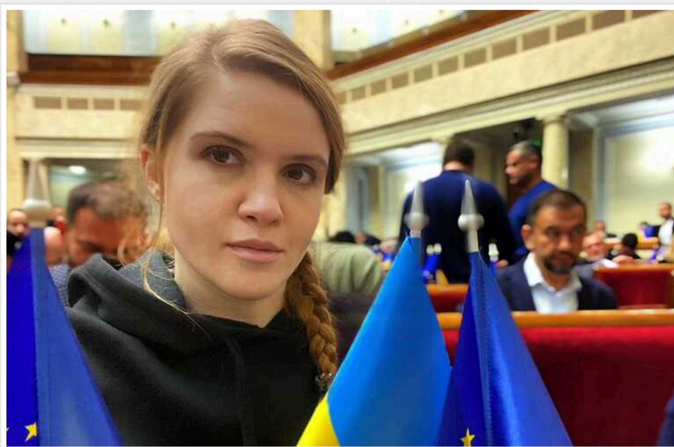
Оборонний комітет Ради проголосував за виключення зі свого складу Мар'яни Безуглої

Через її жорстку критику командування української армії.