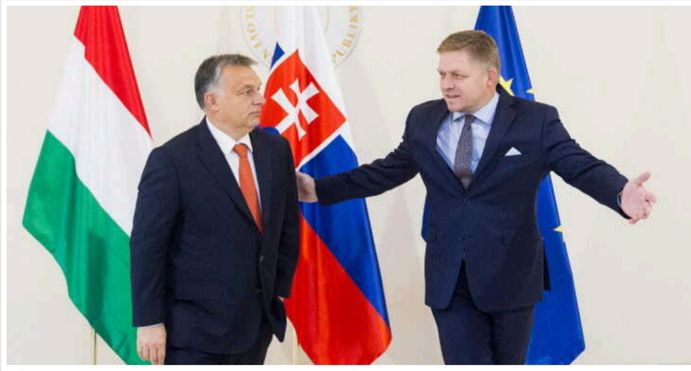
У Словаччині та Угорщині є ризик здорожчання пального після заборони України на транзит російської нафти

Ні Угорщина, ні Словаччина не зіткнуться з дефіцитом пального після того, як Україна заборонила транзит нафти "Лукойла" до Східної Європи, але ціни на їх АЗС можуть зрости.