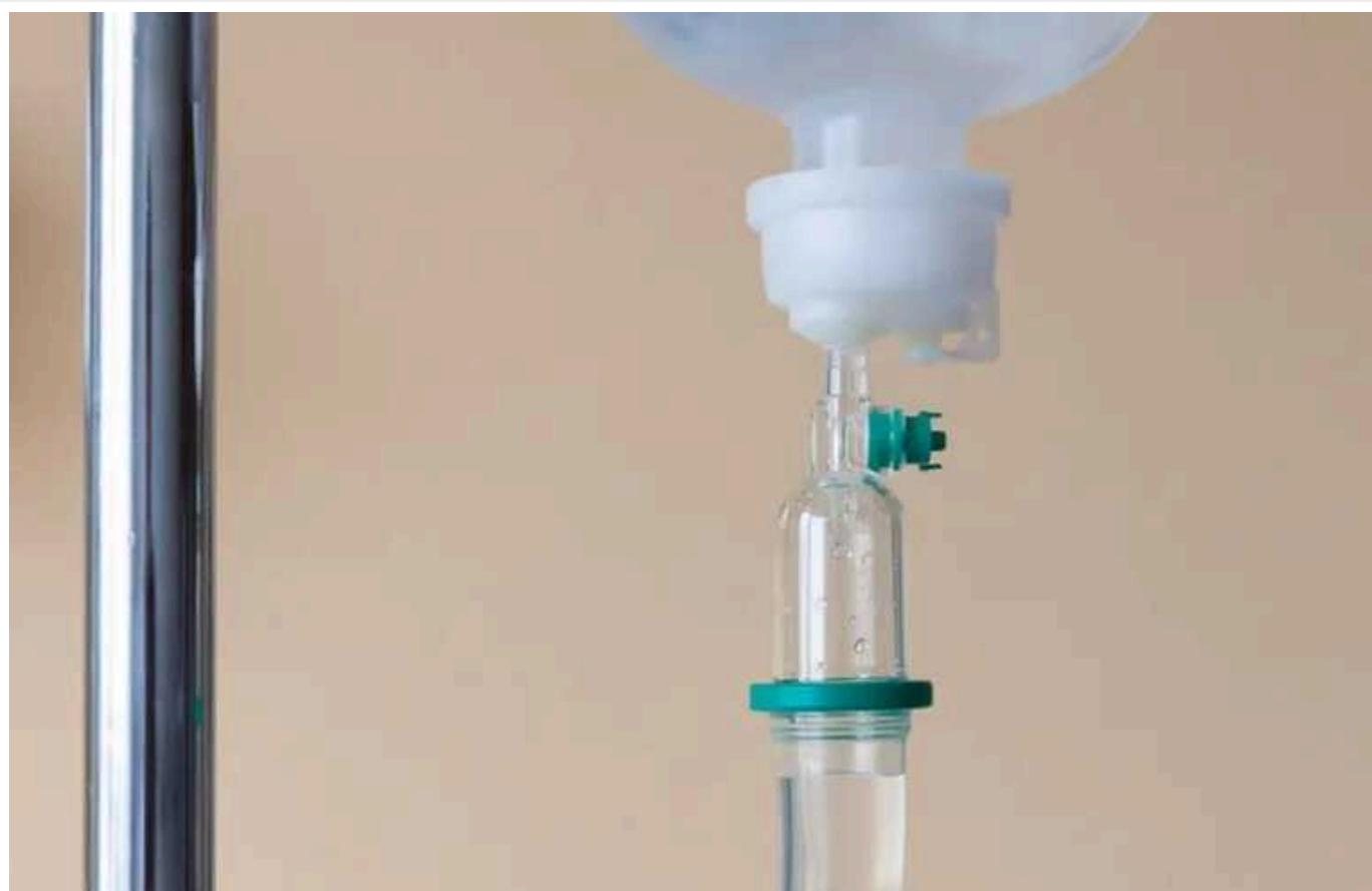
В Індії зафіксували спалах смертельного вірусу

В Індії стрімко поширюється смертельний вірус Чандипура. Хворобою, від якої не існує вакцини та яка переноситься укусами москітів, кліщів та комарів, заразилися вже 50 осіб у штаті Гуджарат на заході країни. 16 загинули, серед них щонайменше вісім дітей.