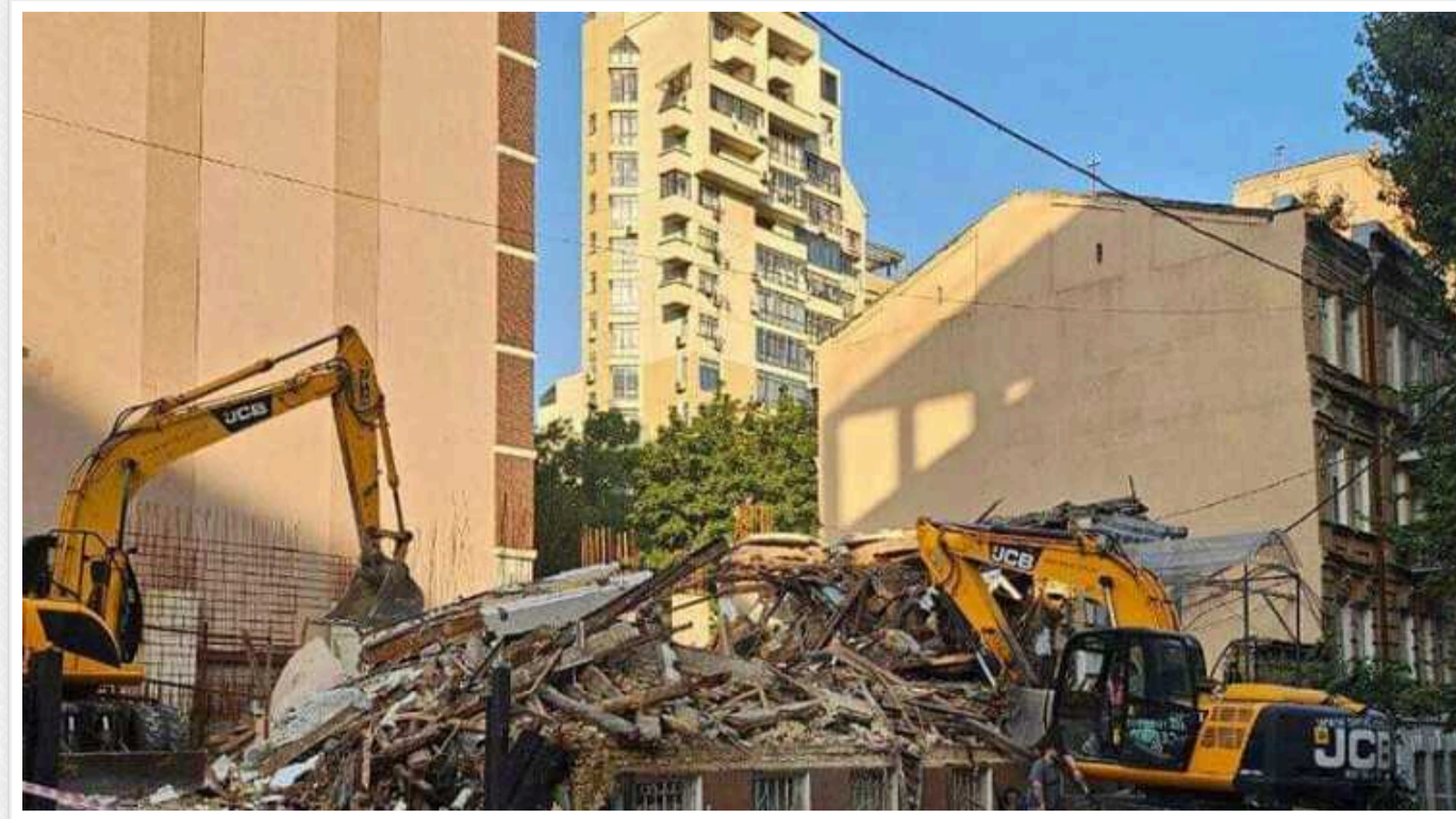
Київські правоохоронці проводять обшуки в руйнівників садиби Зеленських

Поліція Києва проводить слідчі дії в кримінальному провадженні, розпочатому за фактом незаконного знесення садиби Зеленських. Працівники поліції проводять обшуки у власників будинку та в будівельній компанії, яка безпосередньо здійснювала демонтаж будівлі.