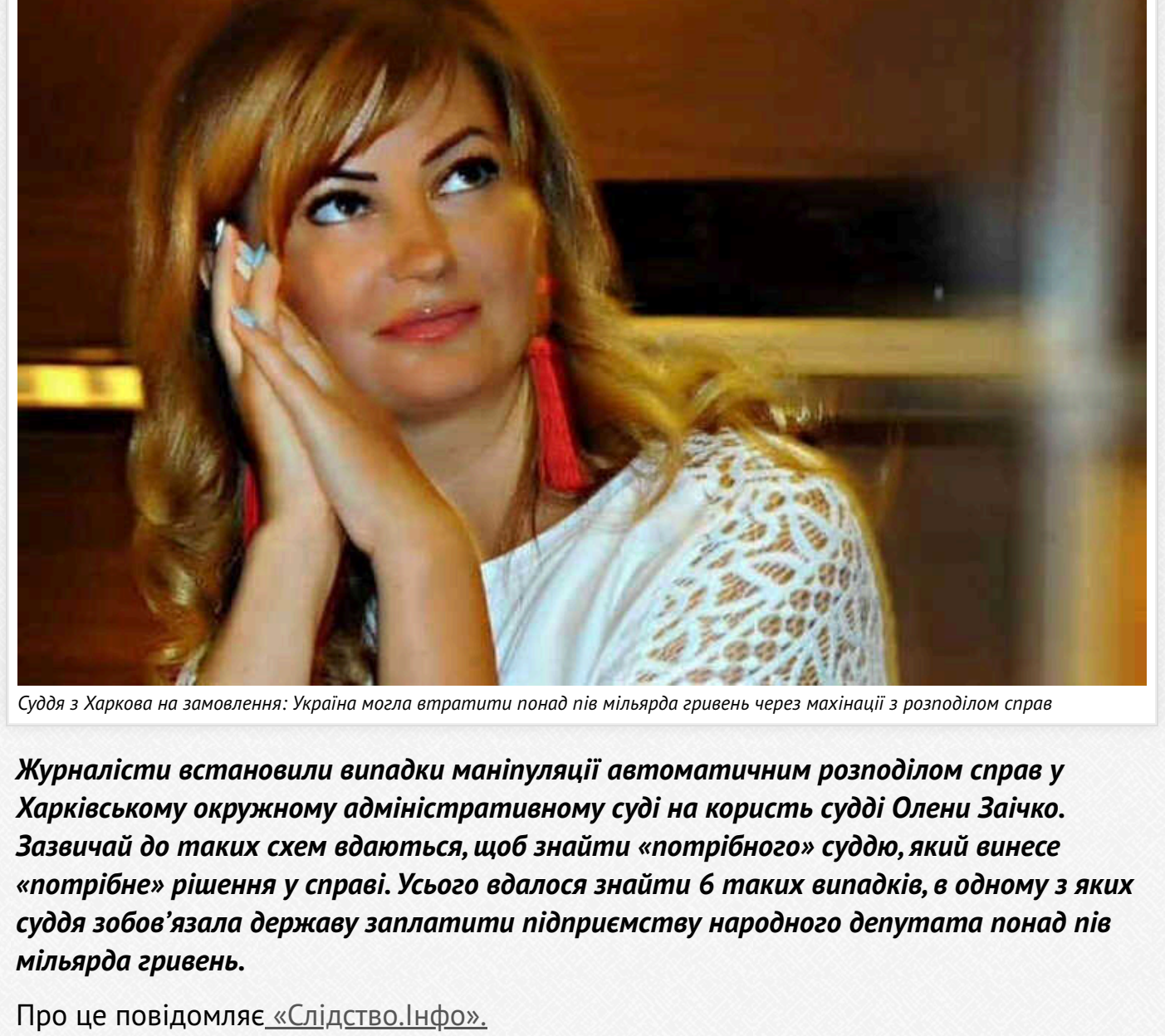
Суддя з Харкова на замовлення: Україна могла втратити понад пів мільярда гривень через махінації з розподілом справ