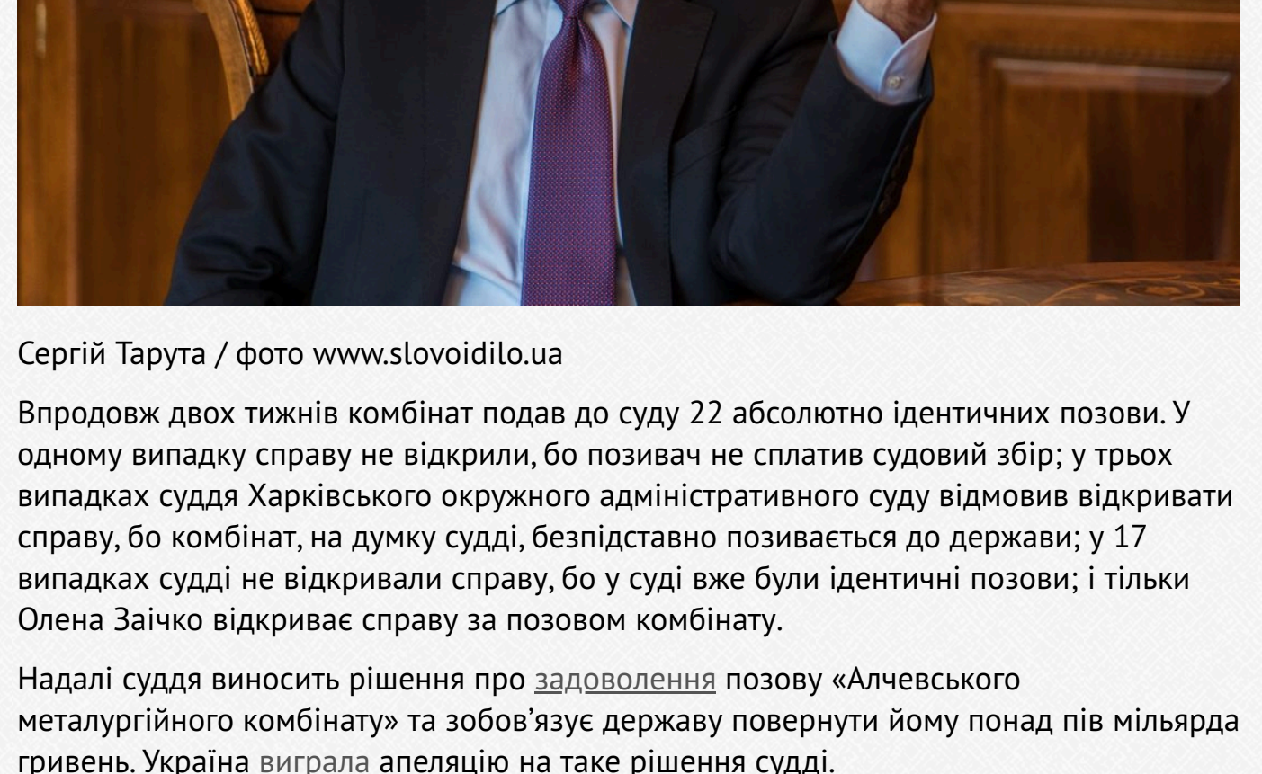
Сергій Тарута

У липні 2018 року Приватне акцієне товариство «Алчевський металургійний комбінат» подало позов до Харківського окружного адміністративного суду, у якому просило зобов'язати державу повернути підприємству надмірно сплачений податок — 582,2 млн грн. Цей підприємство належить СМТ народного депутата від партії «Батьківщина» Сергія Тарута.