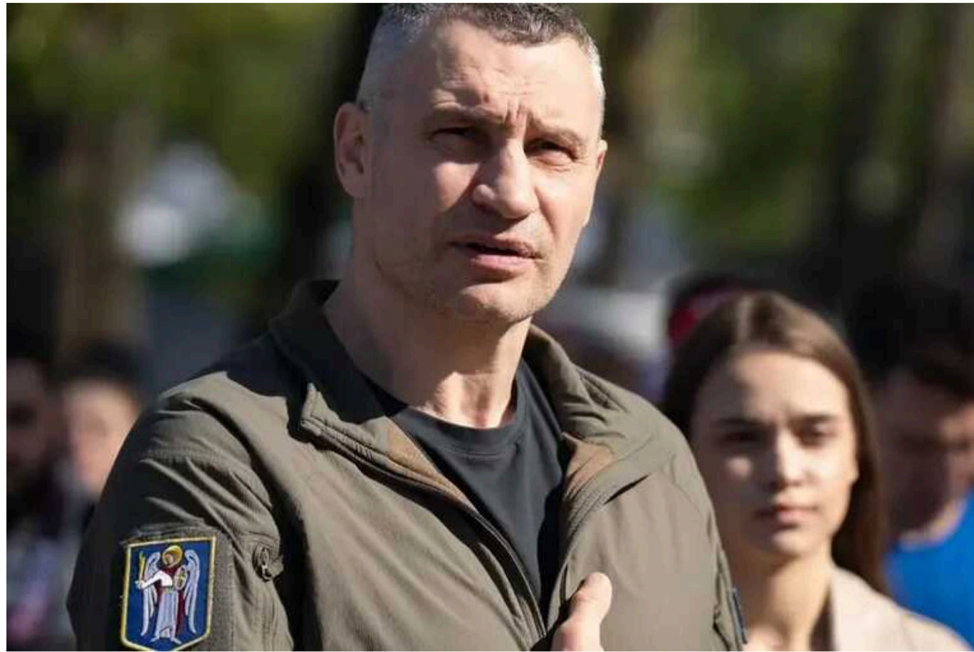
Мер Києва прокоментував несанкціоноване знесення садиби Зеленських

Мер Києва Віталій Кличко заявив, що несанкціоноване знесення садиби Зеленських на вулиці Кониського вважає цинічною провокацією. Він вважає, що правоохоронні органи повинні належним чином відреагувати на це та притягнути забудовника до відповідальності.