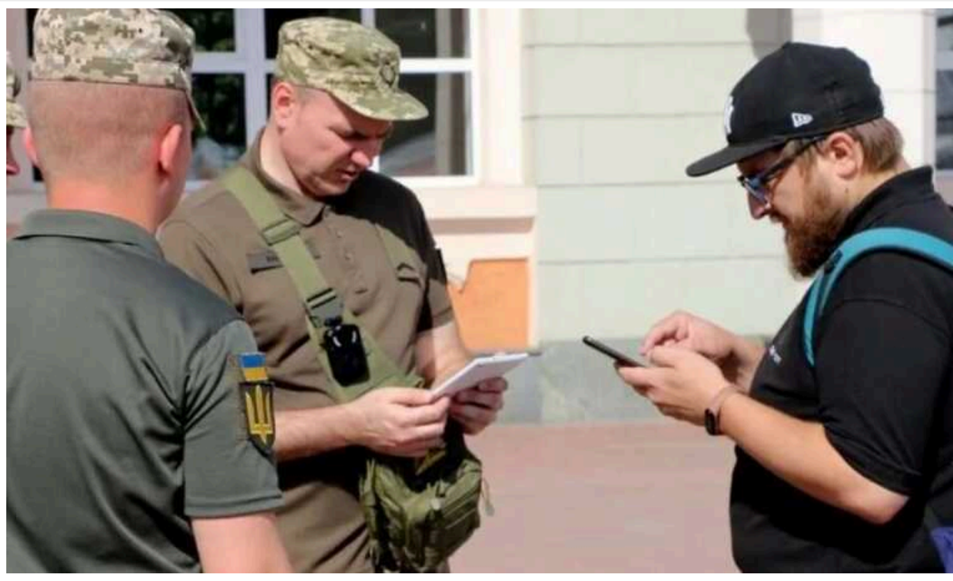
Кого не можуть мобілізувати під час воєнного стану в Україні

Через повномасштабну війну, розв'язану Росією, в Україні діють военний стан та загальна мобілізація, в межах якої підлягають призову військовозобов'язані чоловіки віком від 18 до 60 років. Проте є певні категорії чоловіків, яких не можуть призвати на службу.