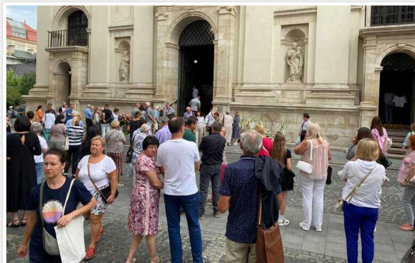
У Львові почали збиратися люди біля храму, де пройде панахида за Ірину Фаріон

У Львові біля Гарнізонного храму Святих Верховних Апостолів Петра та Павла почали збиратися люди, щоб потрапити на парастас (панахиду) за Ірину Фаріон.