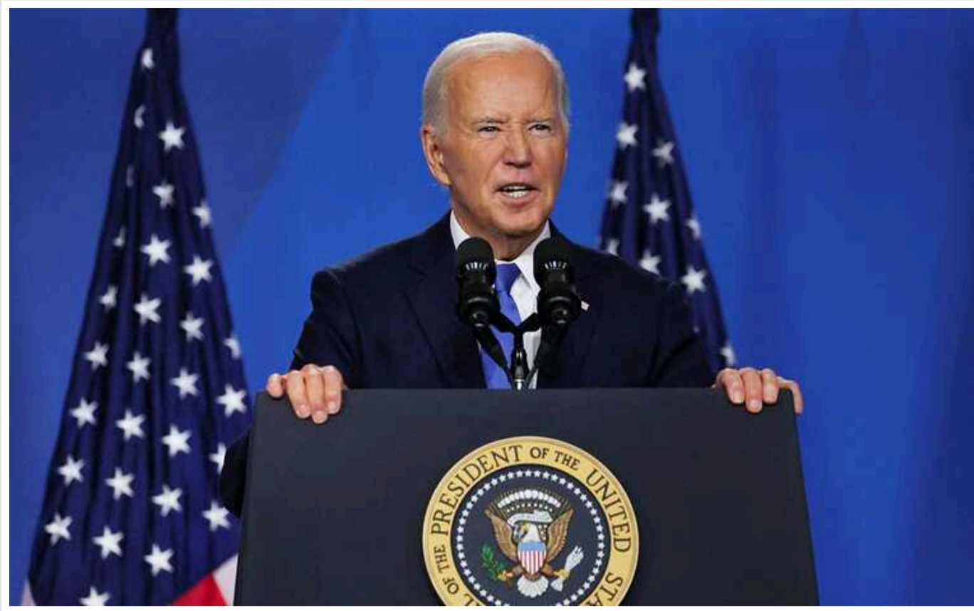
Bloomberg: Байден цими вихідними зробить останню відчайдушну спробу врятувати свою президентську кампанію