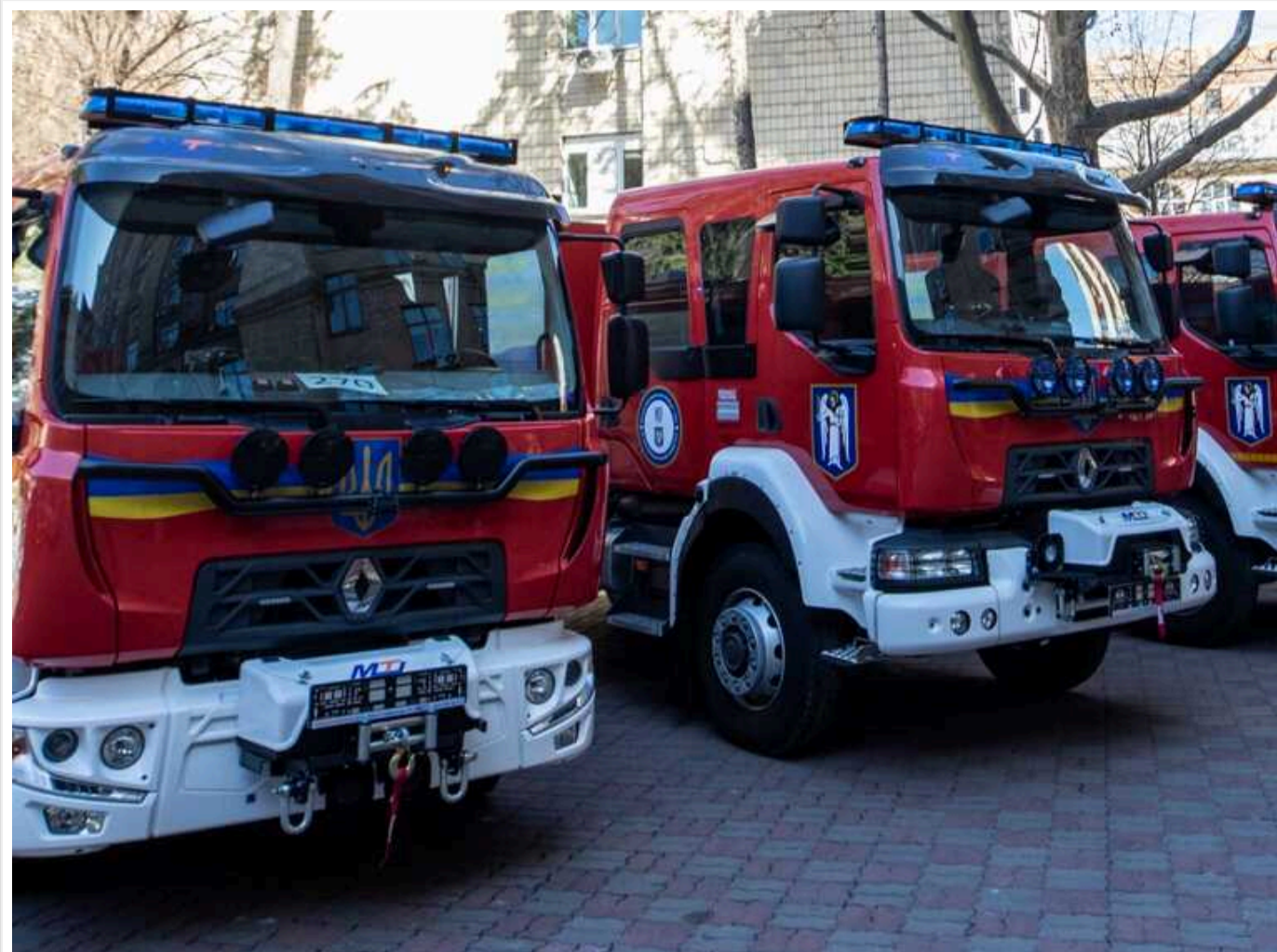
В Україні сталося понад 150 пожеж через повербанки, зарядні станції та генератори, – ДСНС

З початку 2024 року повербанки, зарядні станції та генератори призвели до більш ніж 150 пожеж по всій Україні. Більшість випадків трапляється з причини неправильної експлуатації джерела альтернативної енергії.