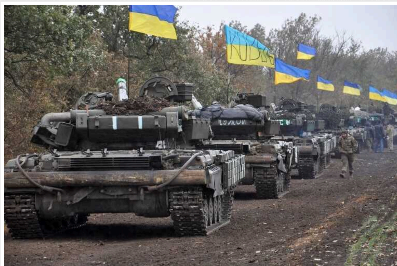
На тлі складної ситуації на фронті та невизначеності щодо майбутньої підтримки Заходу Україна заговорила про переговори, – CNN

CNN пише, що Україна заговорила про переговори – на тлі складної ситуації на фронті та невизначеності щодо майбутньої підтримки Заходу.