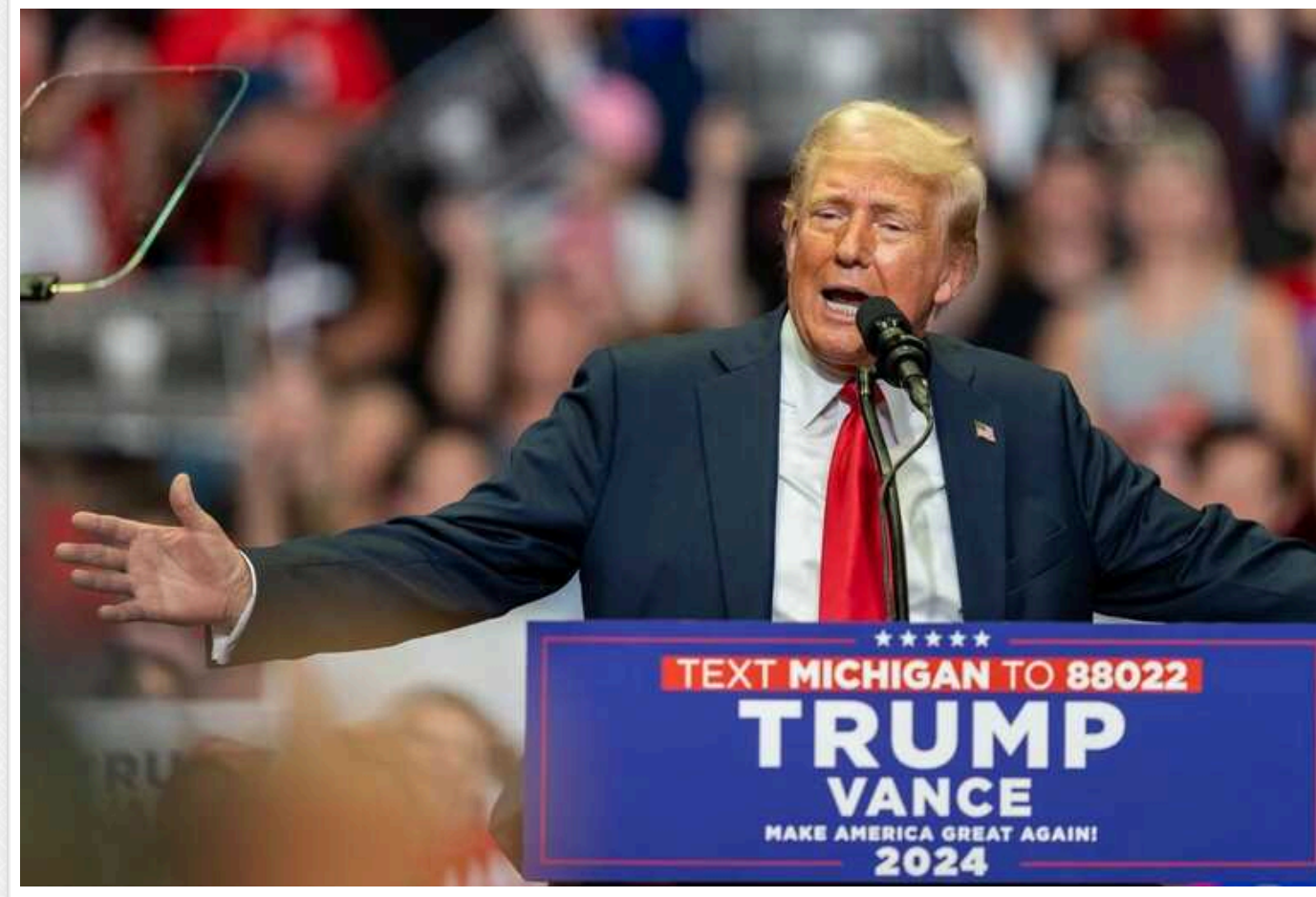
Дональд Трамп вперше після замаху вийшов до людей з відкритим вухом та розповів, за що в нього стріляли

Під час передвиборчого заходу у Гранд-Рапідс, штат Мічиган у США, кандидат у президенти Дональд Трамп знов прокоментував замах на себе. Він назвав себе жертвою демократії, який за неї прийняв кулю.