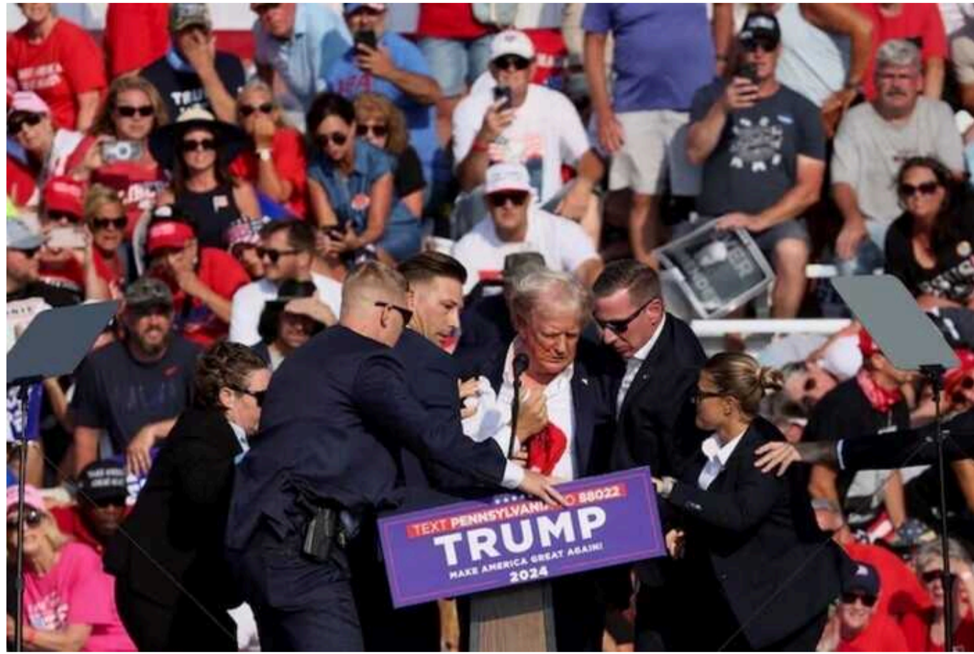
Замах на Трампа: Крукс шукав в інтернеті інформацію про депресивний розлад, шкільну стрілянину та вибухівку

Перед замахом на колишнього президента США Дональда Трампа нападник Томас Метью Крукс шукав в інтернеті інформацію про депресивний розлад, шкільну стрілянину в Мічигані та вибухівку. У телефоні нападника на Трампа знайшли загалом 14 тисяч послань.