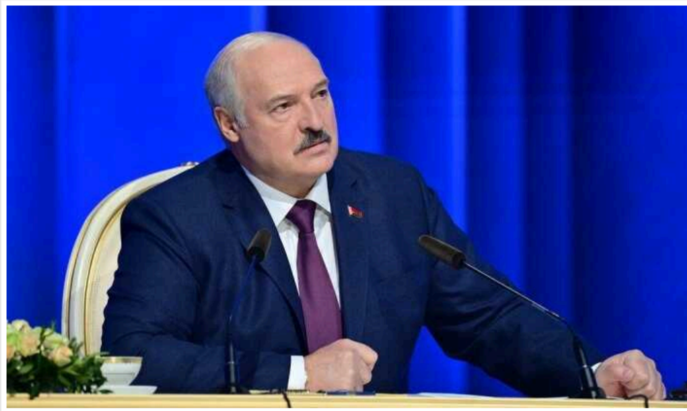
Лукашенко запропонував залучити політв'язнів до ліквідації наслідків від шторму

Самопроголошений президент Білорусі Олександр Лукашенко, нехтуючи міжнародними закликами звільнити політичних в'язнів своєї країни, запропонував залучити їх до ліквідації наслідків від шторму.