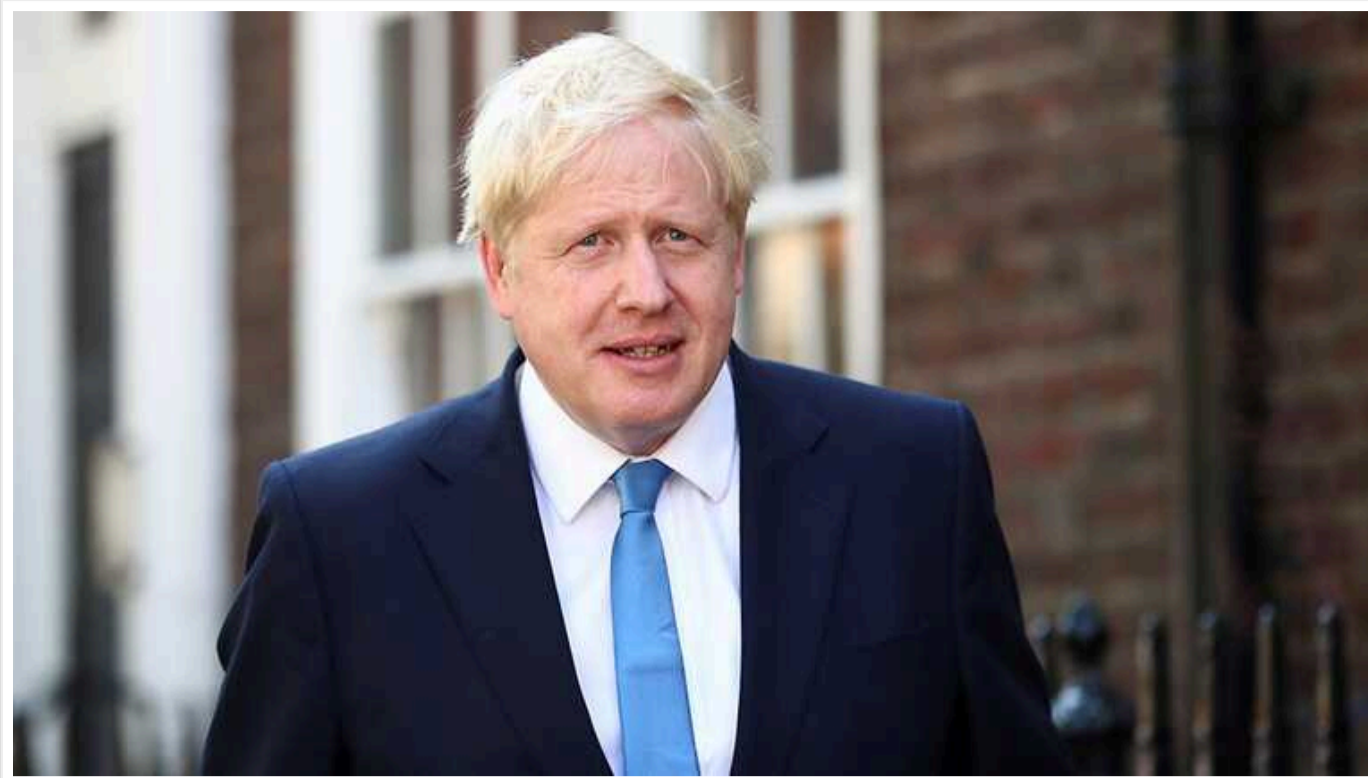
У Daily Mail розповіли про один із варіантів закінчення війни на думку Бориса Джонсона

Daily Mail публікує один із варіантів закінчення війни після приходу до влади Трампа, за думкою колишнього прем'єра Великої Британії Бориса Джонсона.