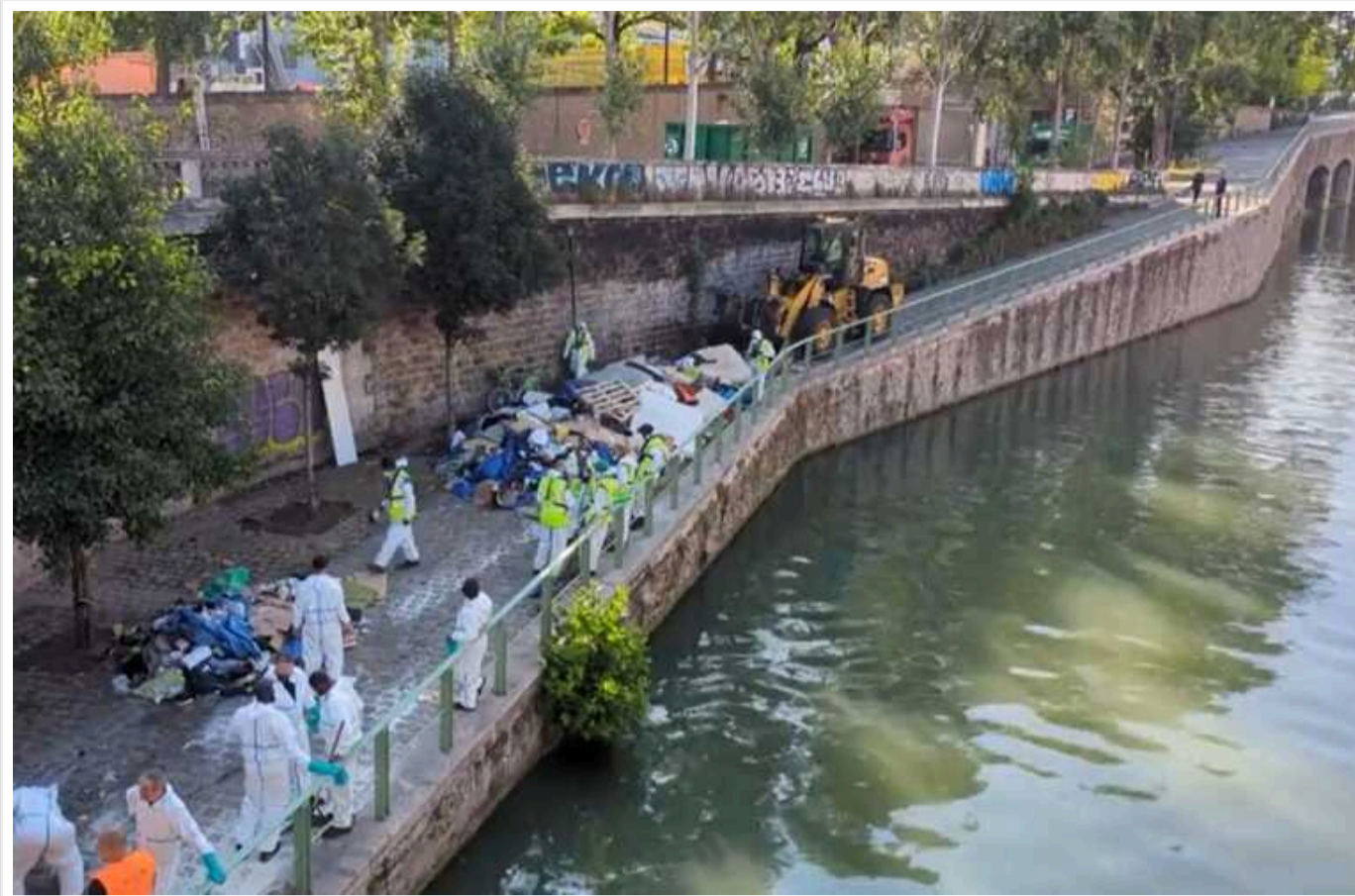
Напередодні Олімпіади в Парижі почали посилено видворяти з міста безпритульних

У Парижі влада напередодні Олімпіади почала посилено видворювати з міста численних безпритульних.