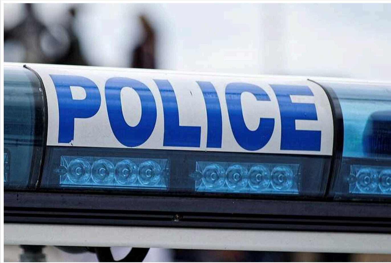
У Штатах заарештували чоловіка, який погрожував вбити Трампа та Венса

У США заарештували чоловіка, який письмово погрожував убивством кандидату в президенти США Дональду Трампу та його напарнику Джею Ді Венсу.