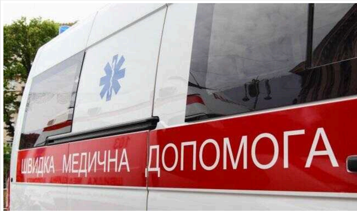
Окупанти влучили по магазину на Харківщині: є поранені

Сьогодні, 20 липня, окупанти FPV-дроном вдарили по селу Івашки Харківської області. Внаслідок влучання у магазин четверо людей поранені.