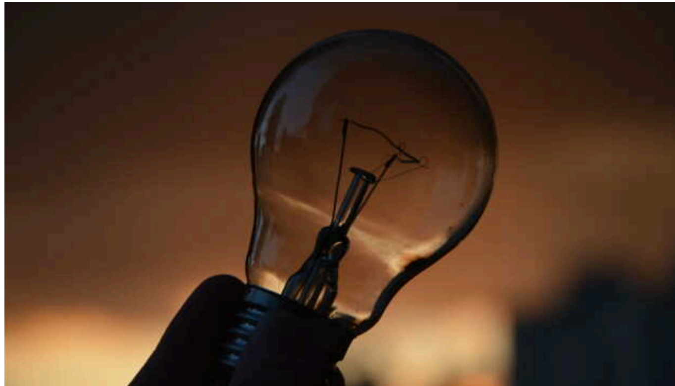
Україна планує залучати допомогу з енергосистем Румунії, Словаччини, Польщі й Угорщини

У суботу, 20 липня, планується імпорт електроенергії з Румунії, Словаччини, Польщі та Угорщини максимальною потужністю 1 385 МВт.