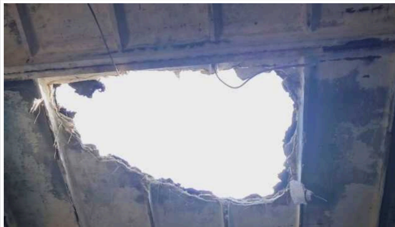
Окупанти минулої доби вбили одного жителя Донеччини, ще шістьох поранили

На Донеччині внаслідок обстрілів російських військ упродовж минулої доби загинула людина, ще шестеро отримали поранення.