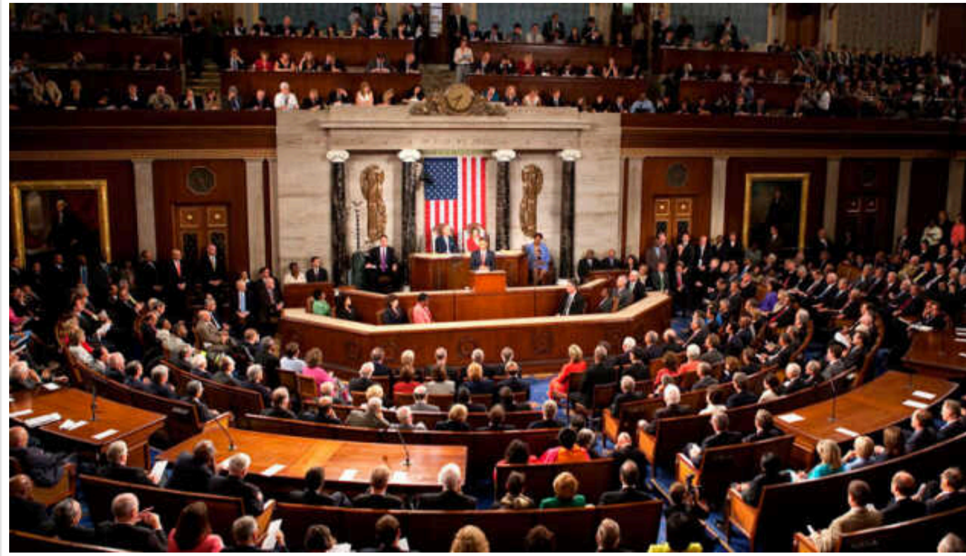
Американські сенатори підтримали скасування обмежень на використання зброї США Україною

Низка американських сенаторів від Республіканської та Демократичної партій висловилися за те, щоб Білий дім зняв для Сил оборони України обмеження на використання американської далекобійної зброї. Вони вважають, що досі підтримка Києва Вашингтоном не була достатньо рішучою і це потрібно виправляти.