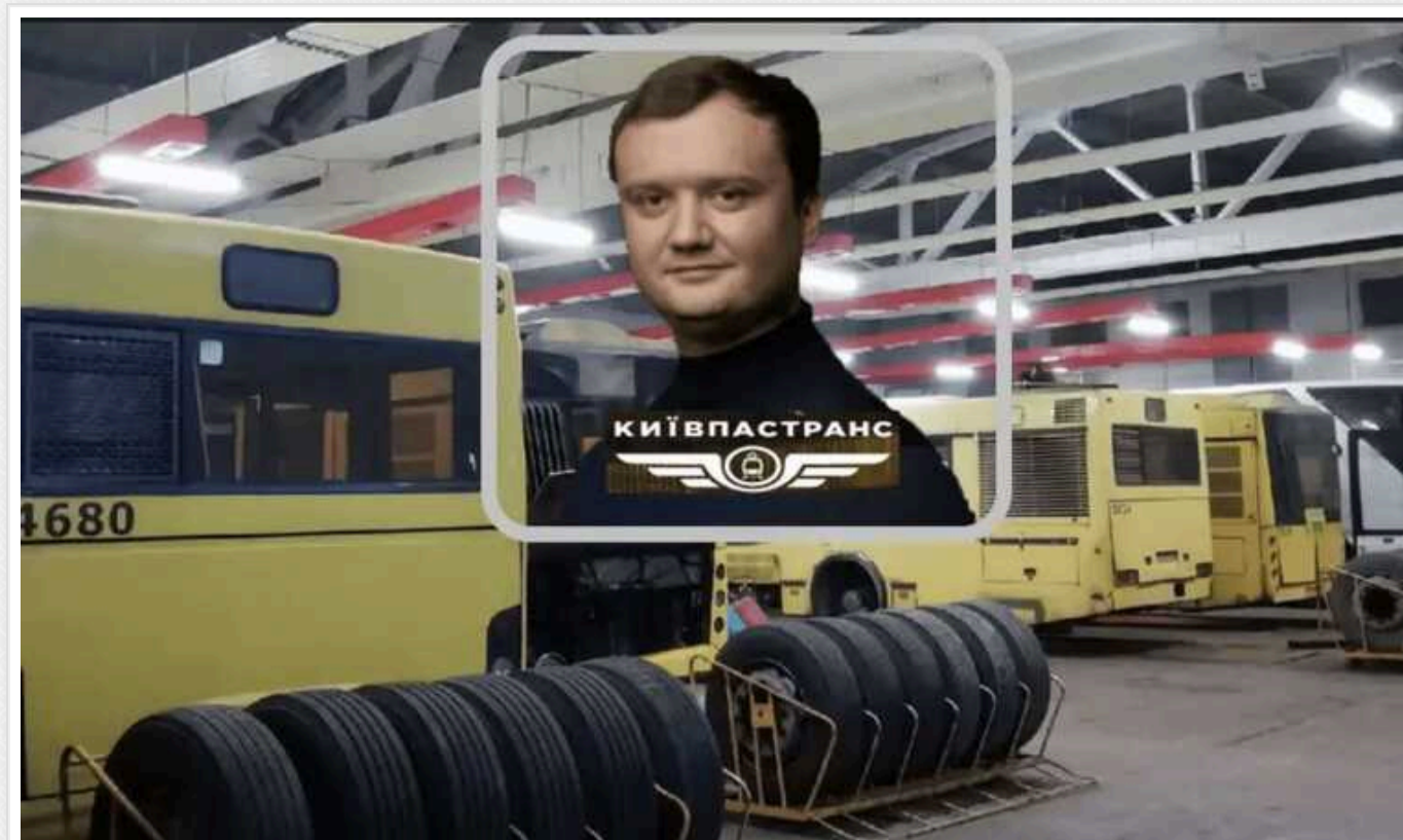
БЕБ і Офіс Генпрокурора розслідують, як у 2021-2023 роках "Київпастрнс" купував шини: "розпил" на 25 мільйонів гривень

Бюро економічної безпеки (БЕБ) спільно з Офісом Генпрокурора розслідують справу щодо можливих розкравдань посадовцями КП "Київпастрнс" бюджетних коштів при закупівлі пневматичних шин.