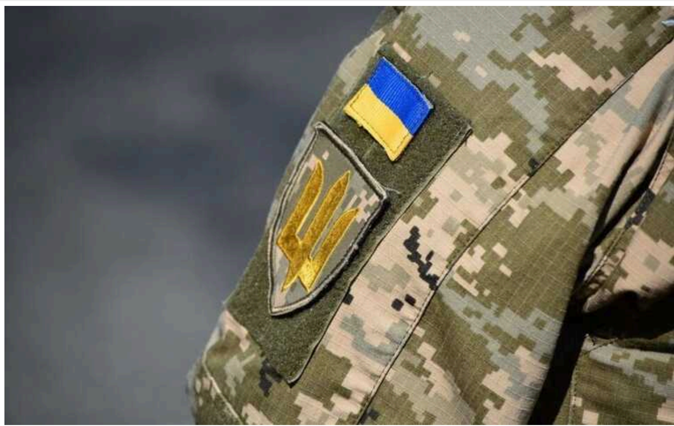
В Україні троє посадовців ЗСУ отримали підозру в корупції

В Україні повідомили про підозру керівникам та службовцям трьох квартирно-експлуатаційних органів ЗСУ, які спричинили збитків державі на загальну суму понад 16 млн гривень.