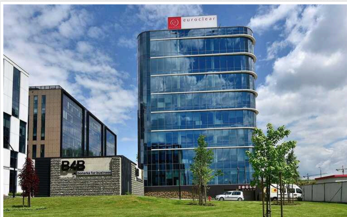
Euroclear найближчим часом переведе 1,55 мільярда євро доходів від заморожених активів РФ в європейський фонд для України

Міжнародний депозитарій Euroclear у липні 2024 року зробить перший внесок у розмірі приблизно EUR 1,55 млрд в європейський фонд для України, повідомляють у звіті компанії.