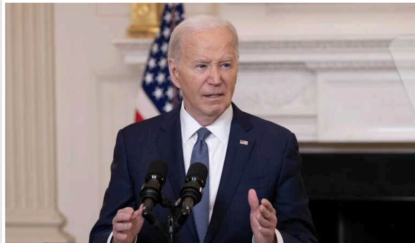
NBC: Сім'я Байдена вже обговорює можливий план виходу з президентських перегонів

NBC із посиланням на джерела пише, що родина Байдена вже обговорює можливий план виходу президента з виборчих перегонів.