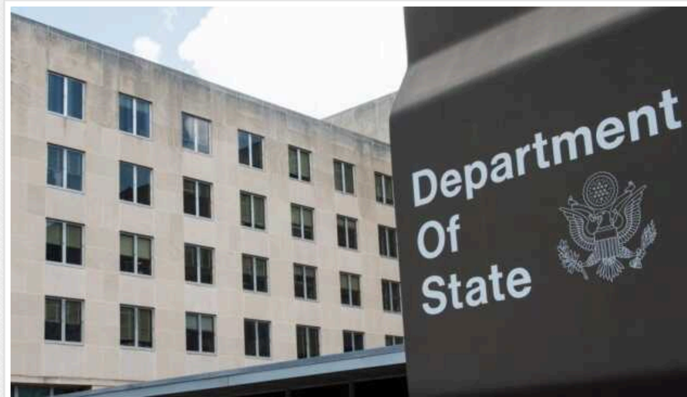
У США відреагували на нові ядерні погрози РФ

Держдепартамент США продовжить "приділяти пильну увагу" діям Росії після її нової ядерної погрози. Там заявили, що будь-яка риторика щодо розгортання ядерних боєголовок викликає занепокоєння.