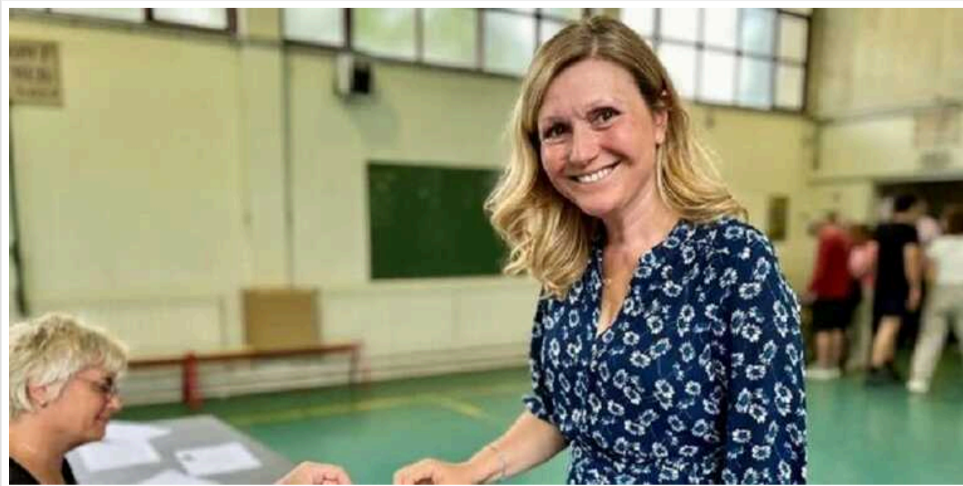
Соратницю Макрона Яель Брон-Піве переобрали спікером Національної асамблеї Франції

Депутати Національних зборів Франції (нижня палата парламенту) переобрали Яель Брон-Піве на посаду спікера. Вона є соратницею французького президента Еммануеля Макрона.