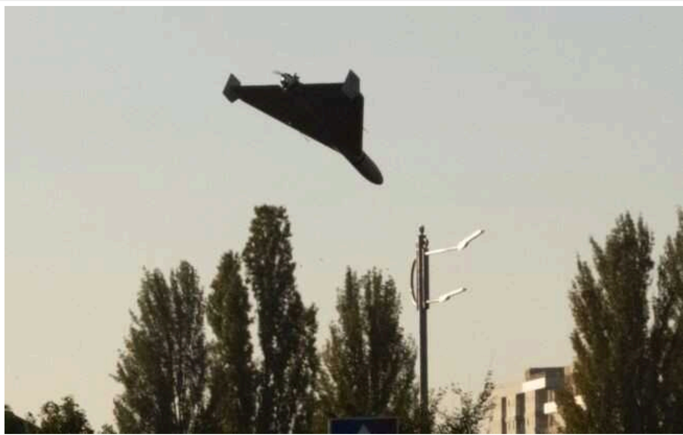
У Польщі відреагували на знайдені деталі у "шахедах"

Член правління держкомпанії WSK Rozpnaj заявив, що паливні насоси їхньої розробки нібито технологічно не пристосовані для живлення авіадвигунів через свою вагу. Журналісти стверджують, що ці компоненти виявили в іранських дронах.