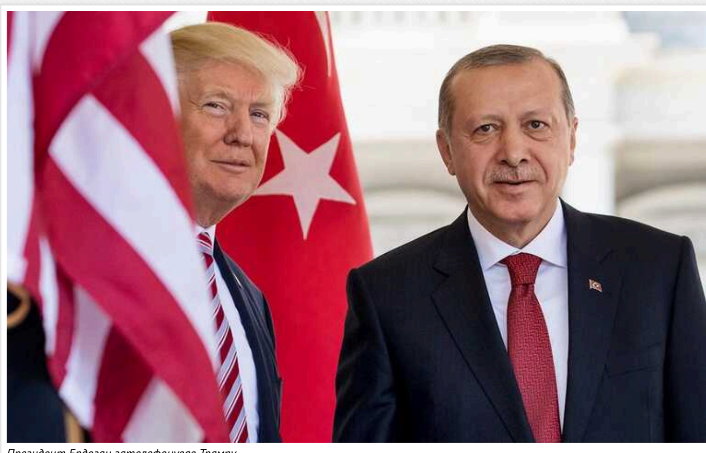
Президент Ердоган зателефонував Трампу

Як повідомляє Al-Monitor, президент Туреччини Реджеп Тайїп Ердоган провів телефонну розмову з Дональдом Трампом, похваливши «сильне керівництво» кандидата у президенти від Республіканської партії після замаху на нього.