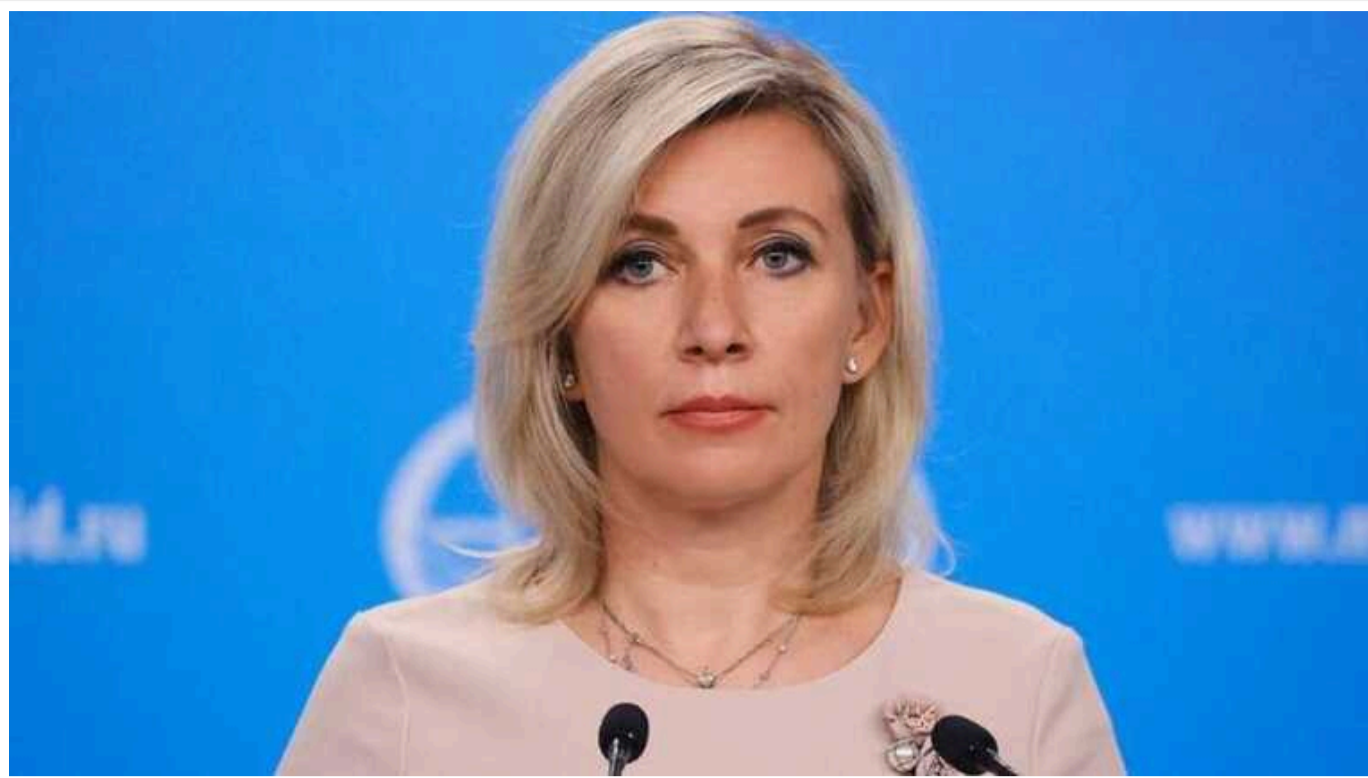
Марія Захарова видала чергове марення про замовників замаху на Путіна

Влада країни-агресора впевнена, що Україна готувала й проводила замаху на російського диктатора Володимира Путіна. Проте планували та фінансували ці замаху якісь "англосаксонці".