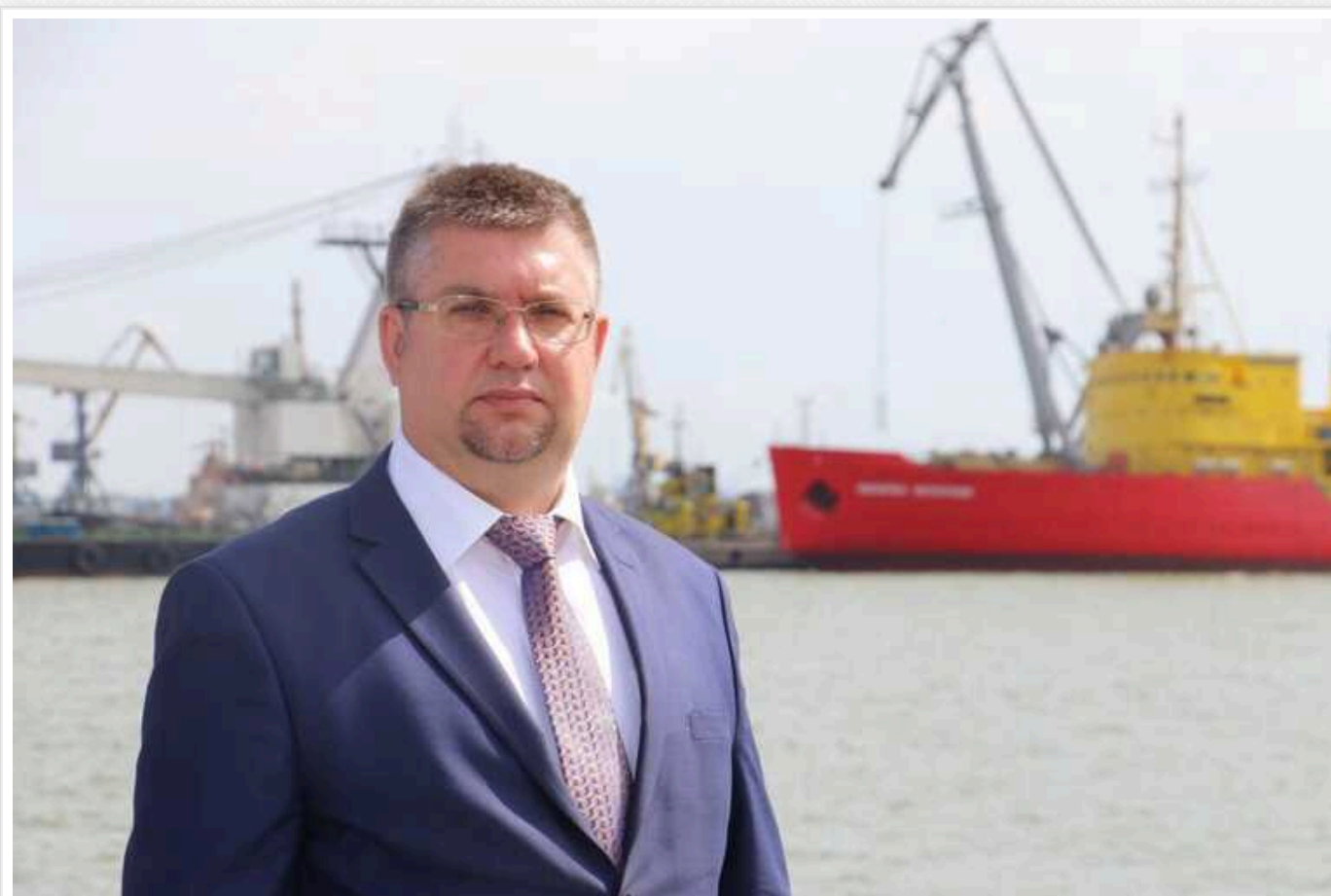
Апеляційна палата залишила відстороненим керівника Маріупольського порту, якого підозрюють у розтраті 13,92 мільйонів гривень