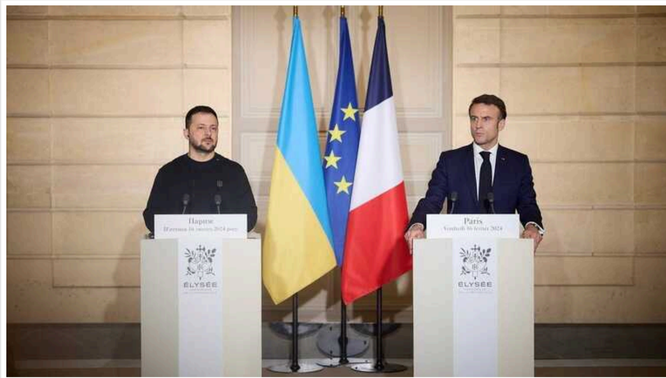
Франція планує поставити Україні новий пакет військової допомоги

Уряд Франції має намір передати Збройним силам України додатковий пакет військової допомоги.