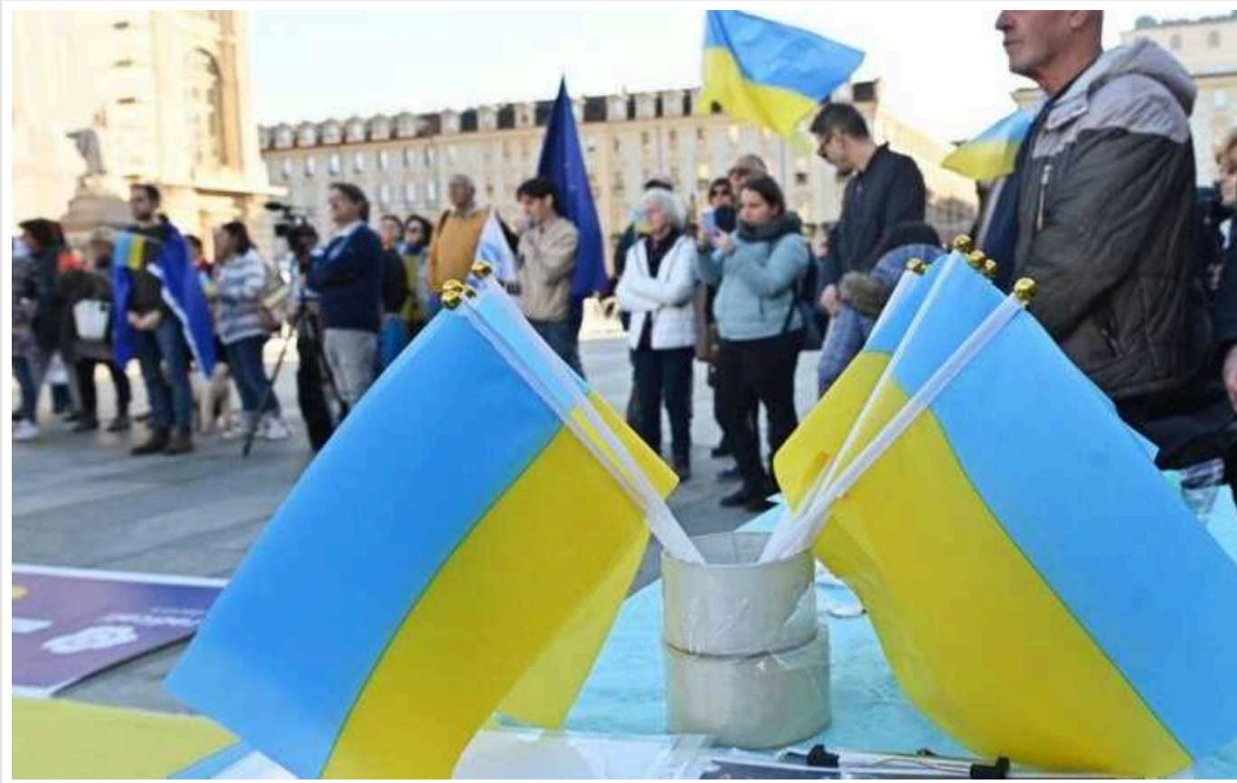
Українці відповіли, з чим у них асоціюється фраза "прості росіяни"

80% українців заявили, що їм спадають на думку лише негативні слова і фрази, коли вони чуять словосполучення "прості мешканці Росії", водночас саме слово "Росія" викликає негативні асоціації у 94% опитаних.